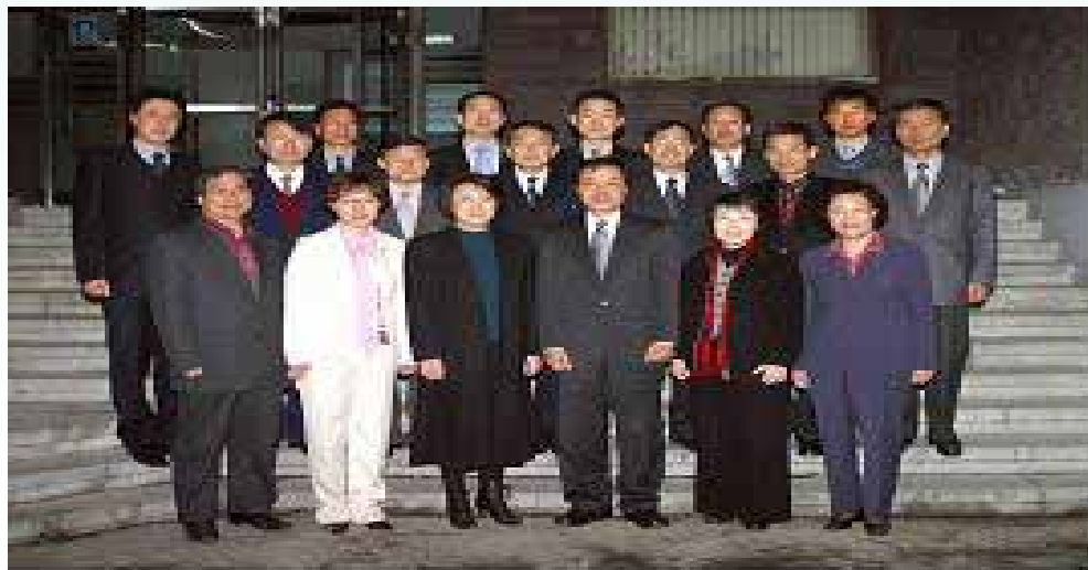
황태경주 지속가능발전위원회 사회·환경·인간 전문가위원회 출범식날 2004.3.10