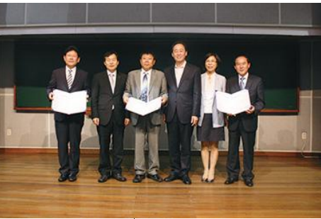
전주 원도심 교육공동체 출범식