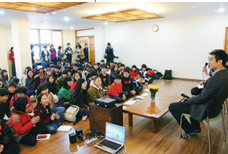
원도심 어린이 멘토교실