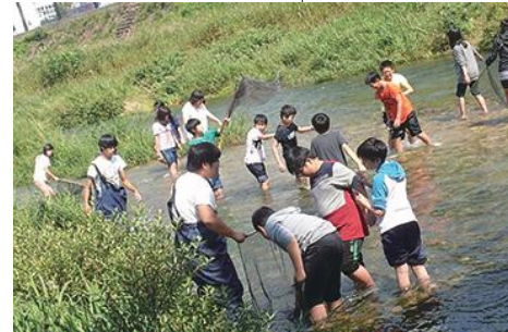
전주천 생태 수업