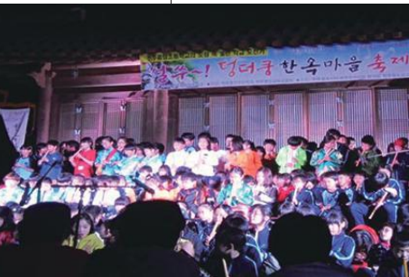
전주 중앙초, 덩더쿵 한옥마을 축제

적 실천 활동이다. 원도심 교육 공동체에는 자치단체와 교육계, 지역사회 전문가 및 시민단체 활동가 등이 폭넓게 참여했다.