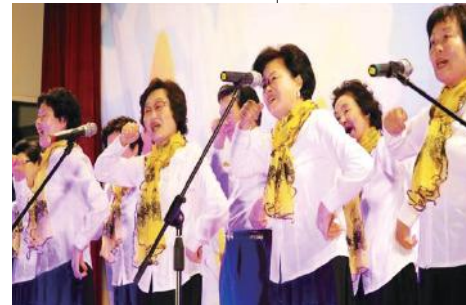
전주 완산초, 완산골 뽕실남실 축제

전주 중앙초등학교는 2015년 10월 '덩더쿵 한옥마을 축제'를 열었다. 2012년 시작돼 네 번째 행사다. 학생들의 학예 발표회와 학부모 발표회, 나눔장터 등의 프로그램이 진행됐고, 해외 교류