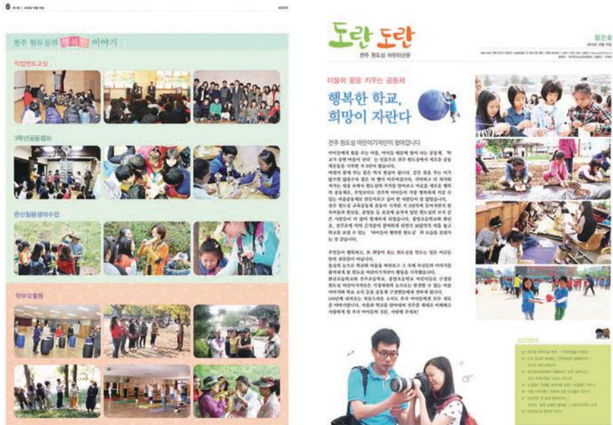
원도심 어린이신문 '도란도란'