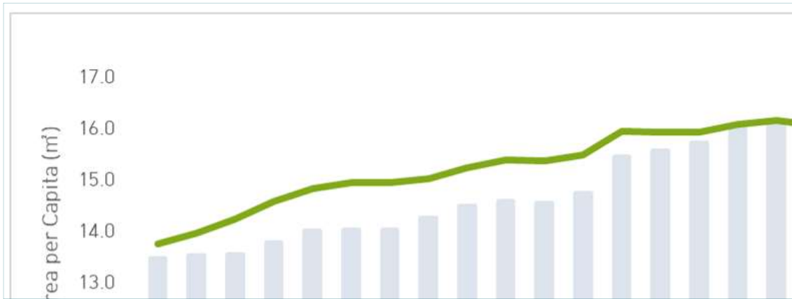
<그림 24> 서울시 공원면적 및 1인당 공원면적 (서울시 공원녹지정책과, 2018)

서울의 1인당 도시공원 면적이 타 국가에 비해 많지만, 서울의 북쪽과 남쪽에 산이 많이 분포하고, 걸어서 10분 거리 내 공원への 접근에 대해 40%는 만족하지 못한다는 것으로 미루어볼 때, 실제로 한 사람이 이용하기 쉬운 공원면적이 많다고는 단정 지을 수 없다. 따라서 녹지면적이나 1인당 공원면적이라는 지표만으로는 도시 내 녹지를 정확히 평가할 수 없다. 양적인 측면과 질적인 측면을 모두 고려하여 평가할 수 있도록 하는 지표의 개발이 필요하다.