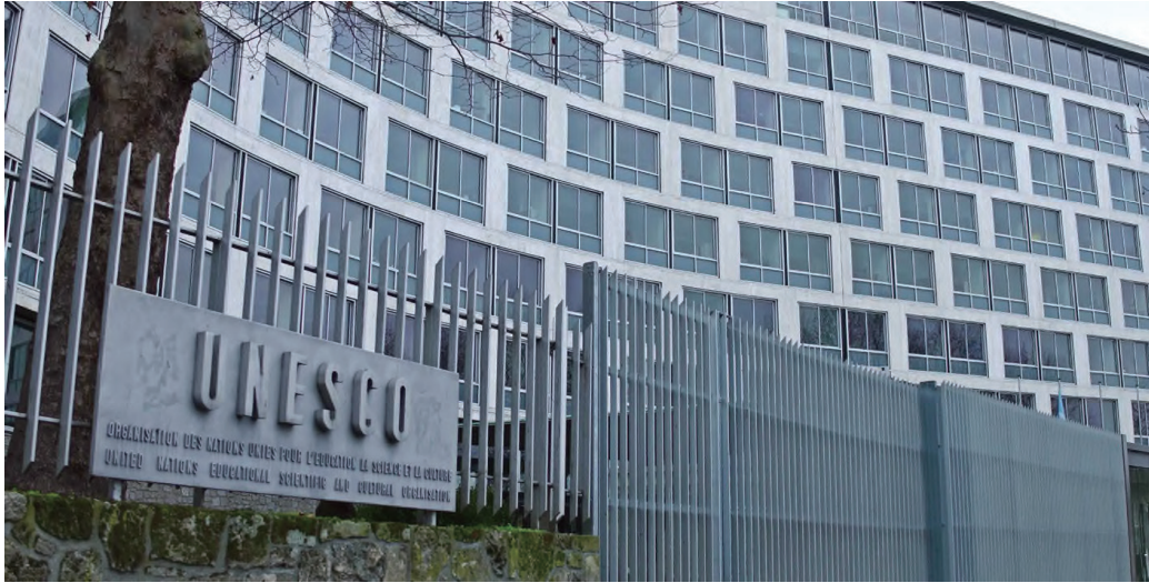
프랑스 파리의 유네스코 본부 건물.