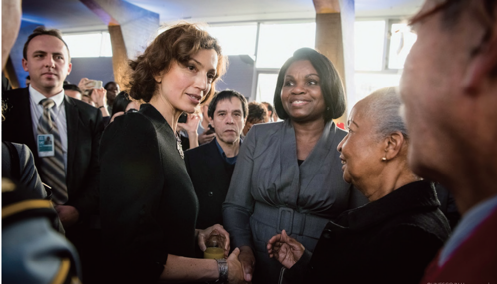
11월 13일 유네스코 총회장에서 열린 프랑스 리셉션(French Reception)에서 오드리 아줄레 사무총장이 참가자들과 대화를 나누고 있다.