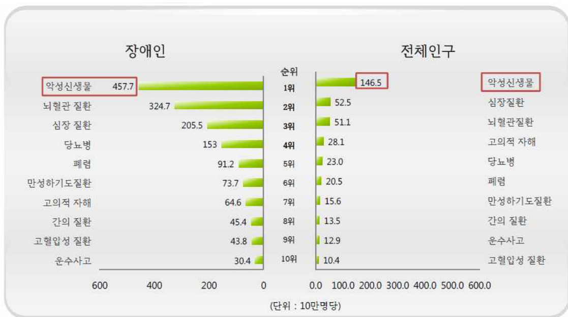
<장애인 사망원인 10순위>