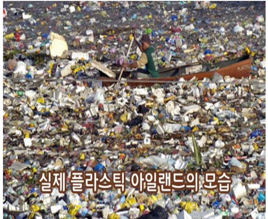
실제 플라스틱 아일랜드의 모습