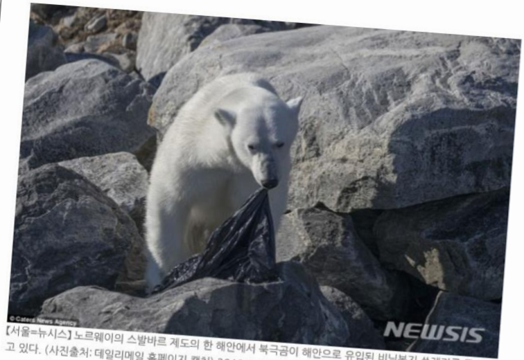
【서울=뉴스시스】노르웨이의 스발바르 제도의 한 해안에서 북극곰이 해안으로 유입된 비닐봉지 쓰레기를 물어뜯고 있다. 2018.08.09.

등록 2018-08-12 05:00:00 | 수정 2018-08-13 09:16:03